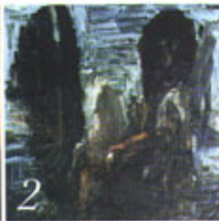
DREAM, THINK, SPEAK, 1981-1982