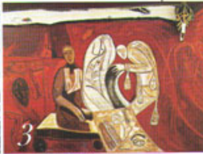
THREE COMETS, 1983