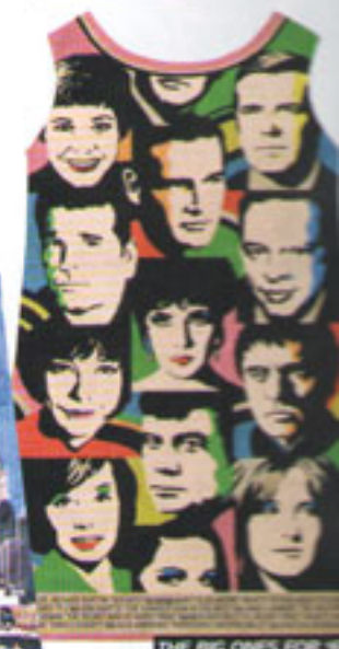
THE BIG ONES FOR '68.