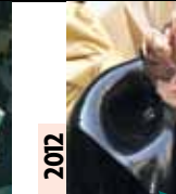
2012 Lady Gaga The Lady ne s'habille pas qu'au rayon boucherie. Elle sait s'entourer de véritables créateurs.