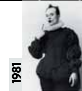
1981 Klaus Nomi À la fois contre-ténor et baryton-basse, le chanteur fut autant icône de la new wave qu'artiste de cabaret au look délirant.