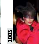
2003 Grace Jones Mannequin avant de devenir chanteuse, elle a été la muse d'Andy Warhol, puis de Jean-Paul Goude. What else?