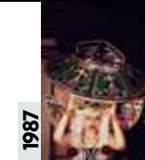
1987 Nina Hagen Issue de la scène punk, la diva berlinoise a essayé tous les styles et toutes les couleurs de l'arc-en-ciel.