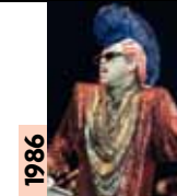
1986 Elton John Aujourd'hui sage papa gâteau, la star a fait son coming out avec son look longtemps avant de révéler son homosexualité.