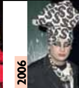
2006 Boy George Tout comme sa voix, le look du Boy est inimitable. Et sa garde-robe, aussi remplie que son casier judiciaire...