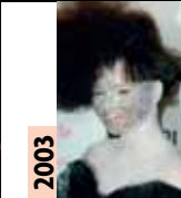
2003 Björk L'islandaise est une grande exploratrice du son et de la voix. Et côté tenues, elle repousse également loin les limites.